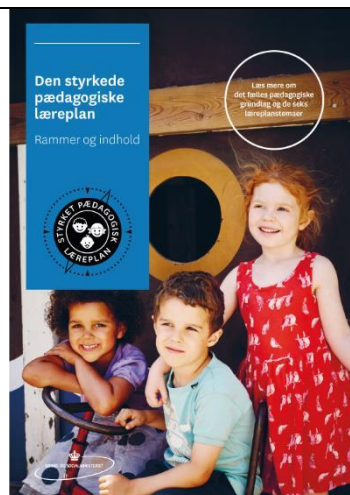
Den styrkede pædagogiske læreplan. Rammer og indhold

Inden for de krav, der følger af dagtilbudsloven, er det op til jer at beslutte, hvordan I konkret vil arbejde med den pædagogiske læreplan. Jeres læreplan skal være et dynamisk og meningsfuldt dokument, som peger fremad, og som I kan bruge aktivt i den løbende udvikling af den pædagogiske kvalitet og jeres pædagogiske praksis.